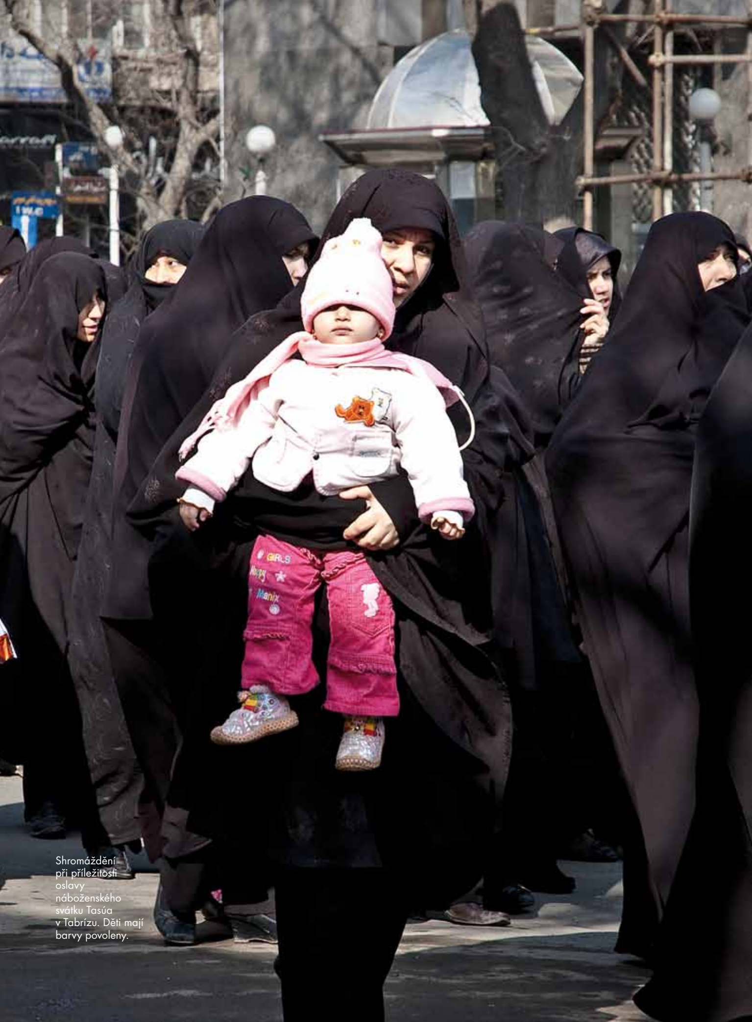
Shromáždění při příležitosti oslavy náboženského svátku Tasúa v Tabrízu. Děti mají barvy povoleny.

pení. Íránci jsou jejímu psychologickému působení vystaveni nepřetržitě, najdete ji všude: na plavkách i na nepřeborném množství uniformních hábitů, které se sbíhají k modlitbám v mešitách. V roce 2009 se zablýsklo na lepší časy: proti konzervativní černé se postavilo tajné, ale masové opoziční hnutí, takzvaná „zelená revoluce“, a Teherán zažil největší manifestace od převratu v 70. letech. Nic se však nezměnilo.