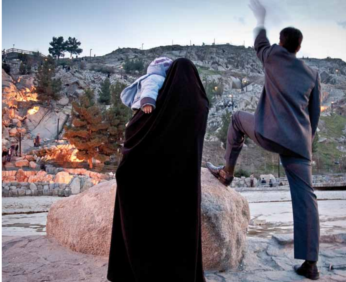
V parku Mashhad tráví volný čas mládež a rodiny s dětmi.

J EDNA ZEMĚ, DVĚ RŮZNÉ REALITY. Jen jedna z nich je skutečná, zároveň však také omezená a klaustrofobická. Neliší se od té naší a lidé ji žijí uvnitř svých domovů. Běžné oblečení, soužití, běžný přístup ke všemu, co zahrnuje dnešní moderní svět, přístup k internetu i satelitní televizi. Hraničním pásmem jsou domovní dveře. Za nimi číhá virtuální svět. Jeden krok ze dveří stačí, abyste se ocitli ve středověku. Jeden krok a propadnete se do šeré minulosti, která na veřejnosti halí Íránky do černých hábitů a temných hidžábů. Každodenní život obaluje čern, jako by svět nikdy neznal škálu barev. A zatímco domovy Íránců hýří barvami, mimo něj existuje jen svět černé – a černé.